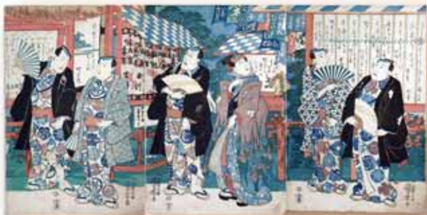
歌川国定画「川柳の奉納額がある役者絵」(仮題)