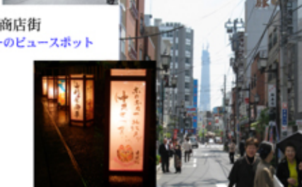
*燈籠会の川柳燈籠 合羽橋本通り かっぱの里