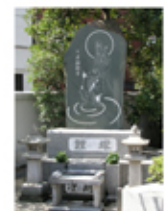
浄土宗・龍宝寺鯉塚 *別名・鯉寺