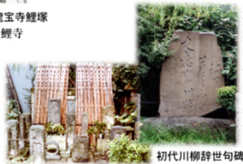
木枯や踏て身をふけ川柳・久良伎書