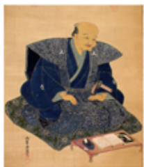
元祖橋井川柳家藏像(川柳家藏)