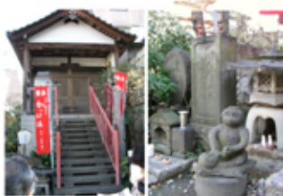
かっぱ寺(曹源寺) *河太郎墓 *河童のミイラ