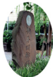
菊屋橋公園 *初代川柳顕彰碑