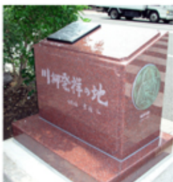
川柳発祥の地記念碑