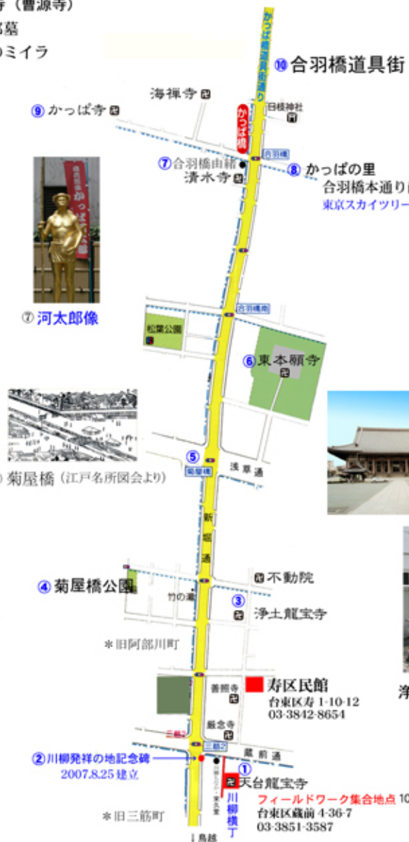
天台龍宝寺(別名:川柳寺)