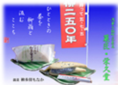
川柳にちなむ銘菓 榮久堂 *柳多留もなか *川やなぎ